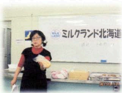
料理教室実施風景