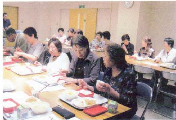
恵庭中学校給食センター