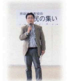
水内課長のご挨拶