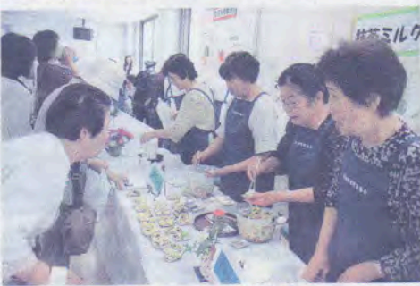
試食コーナーが大人気