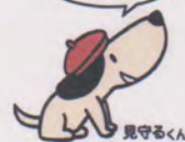
平成30年度 恵庭市消費生活相談室 相談受理件数