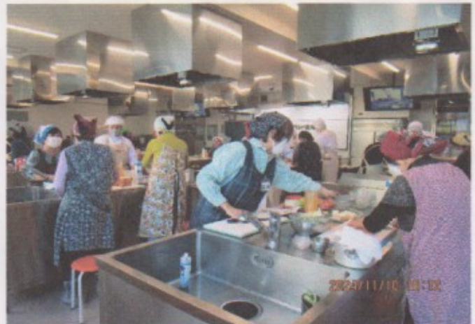
11月 牛乳料理講習会