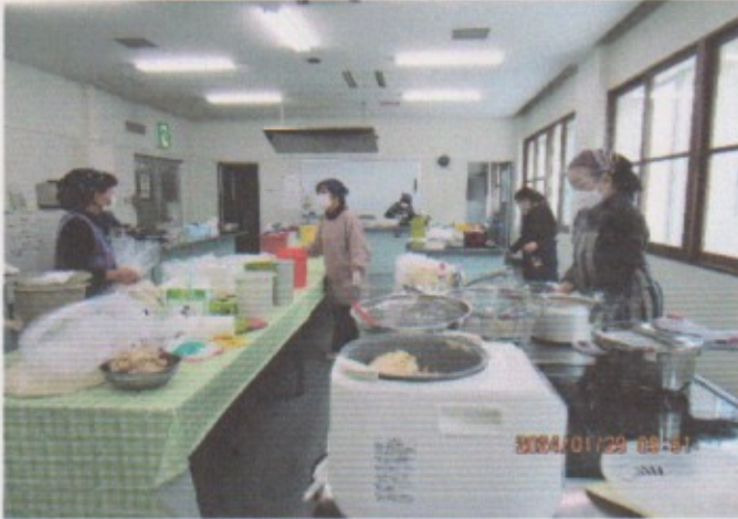
1月 手作り味噌作り