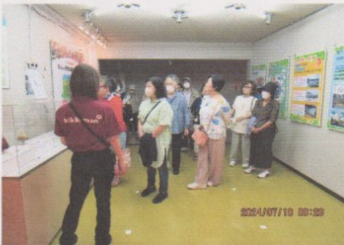
7月 研修旅行（キッコーマン工場見学）