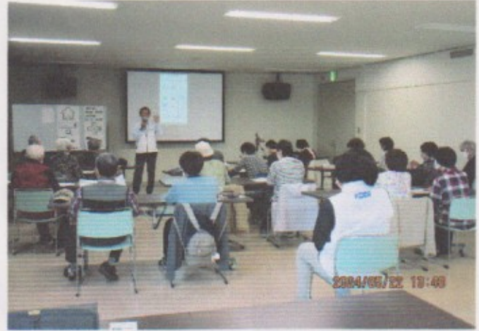
5月 高齢者のスマホ教室