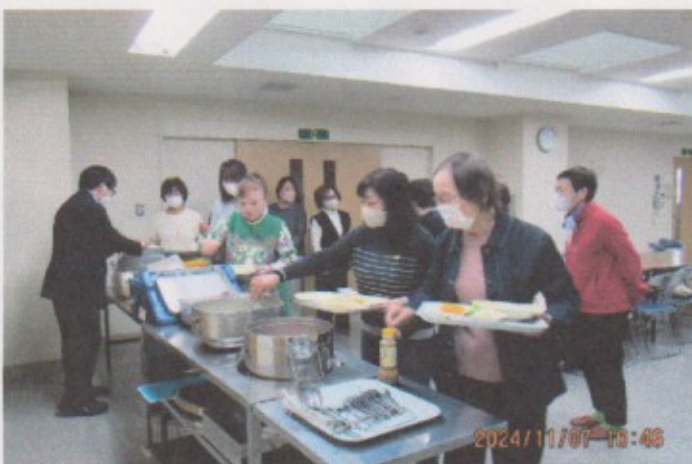
11月 給食センター試食会