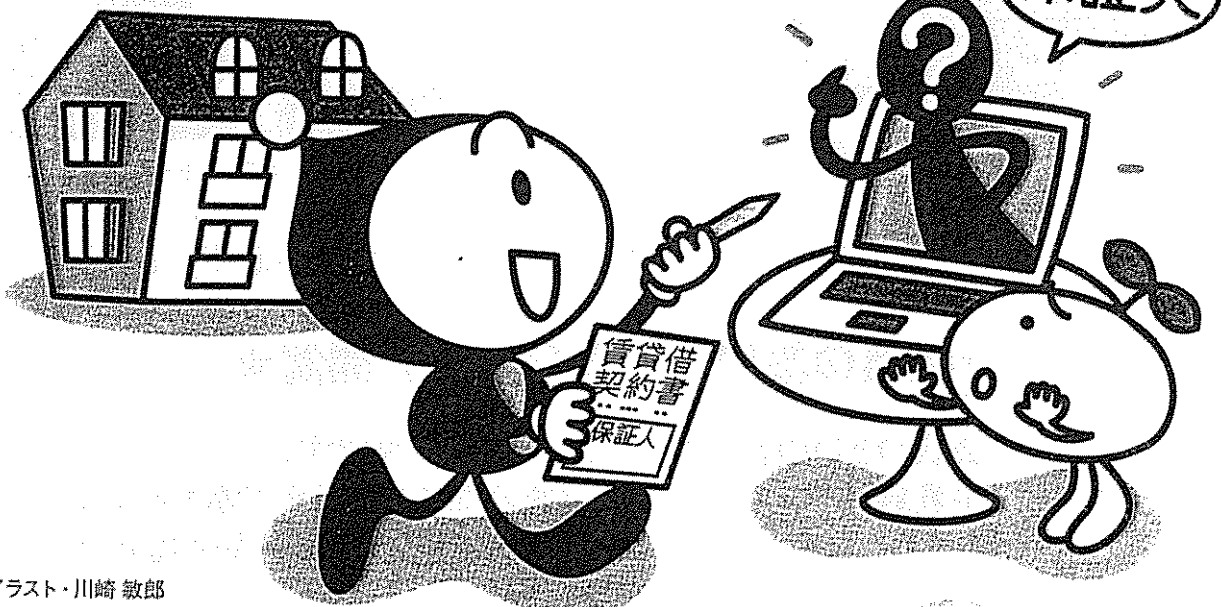
イラスト・川崎 敏郎

インターネットを通じて保証人紹介業者（以下「紹介業者」）に申し込みをしたところ、「保証人を紹介さねなかった」「キャンセルを申し出たら拒否された」といったトラブルが増加しています。また、「保証人として紹介業者に名義登録をすれば報酬を得られるというところで登録したところ、多額の債務を負わされてしまった」というトラブルもあります。