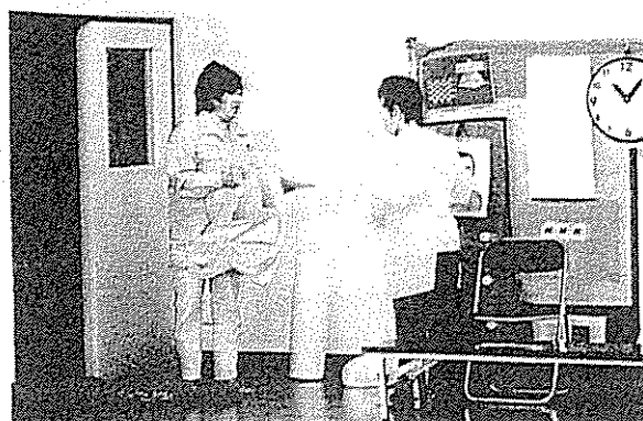
ふとんのクリーニングしませんか？