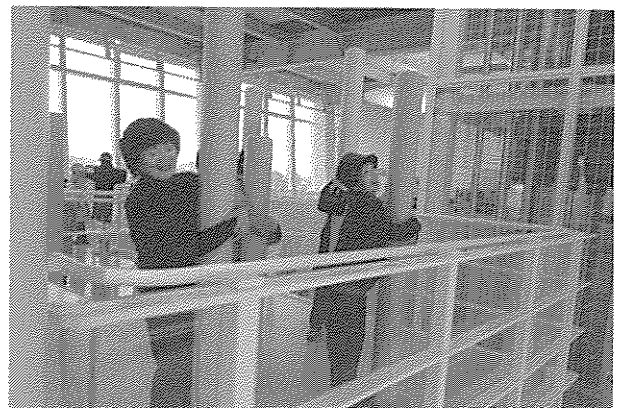
顔は笑っていますが・・・