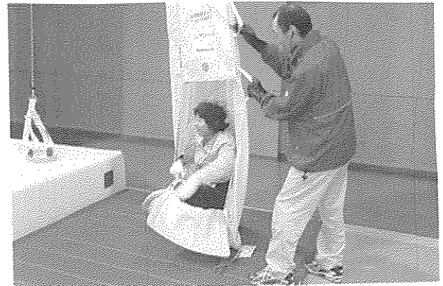
2階の高さから滑り降ります。