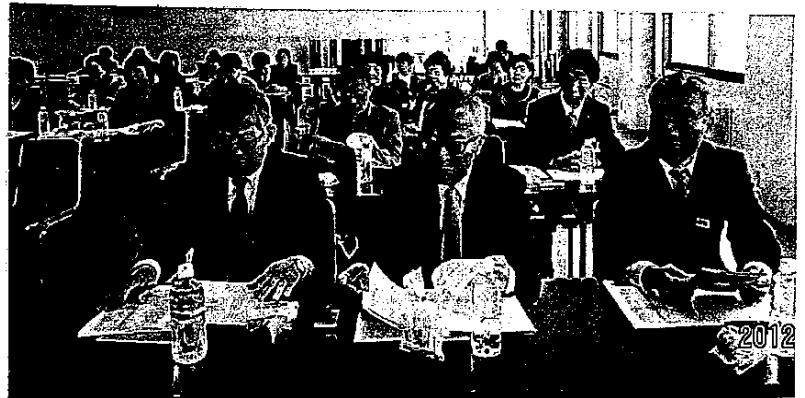
総会時の会場の様子