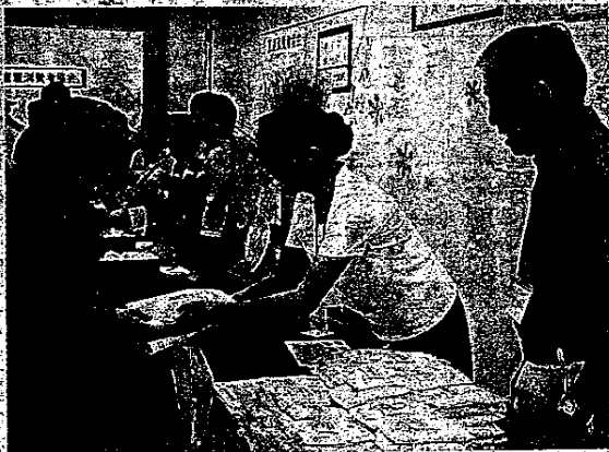
人気を集めたお米の無料配布