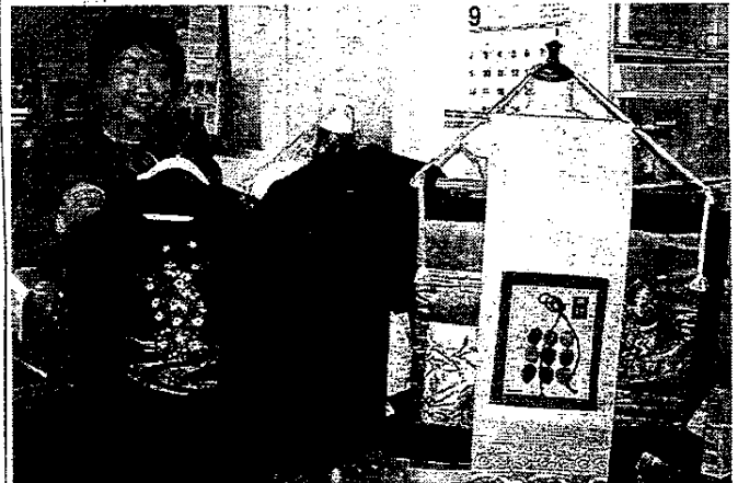
着物のリメイク作品をPRする北口会長